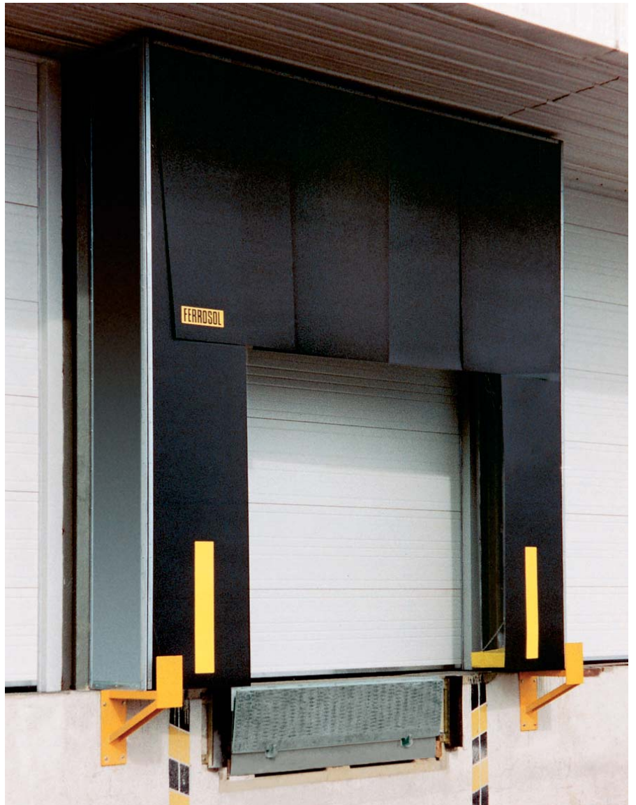
Punto de carga: Abrigo, Puerta seccional y Rampa.