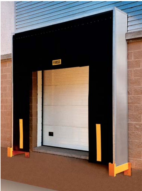
Abrigo y Puerta seccional.

Dos protectores (viga U) con pletina frontal y acabado en esmalte amarillo.