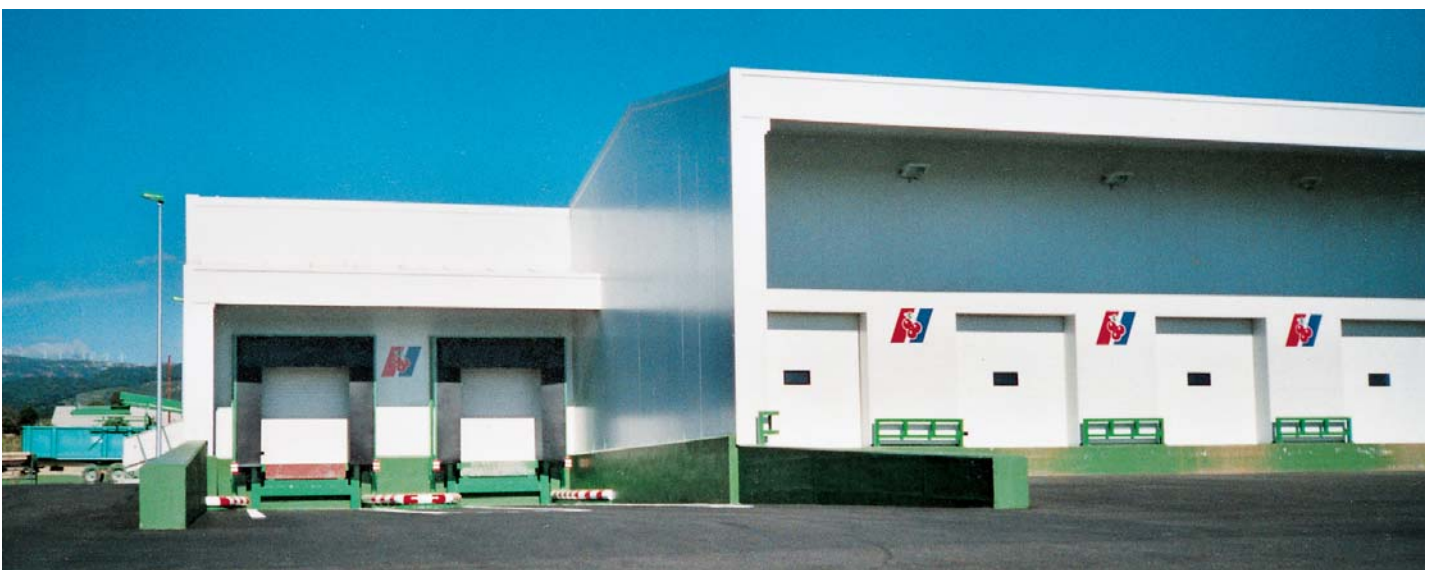
Muelle de carga completo.