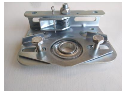
Placa base seguridad muelles