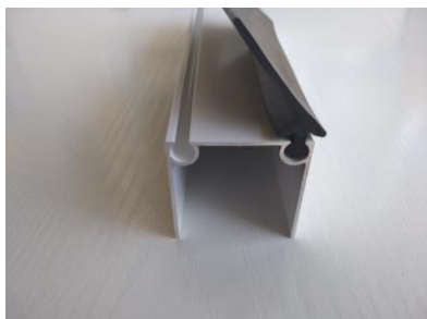
Perfil con goma superior