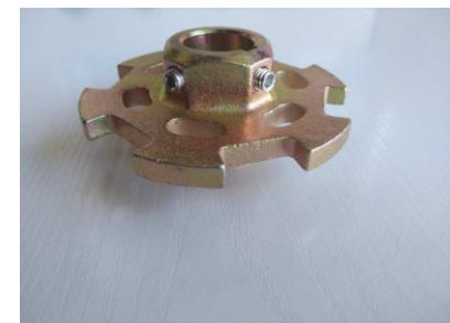
Seguridad de muelles