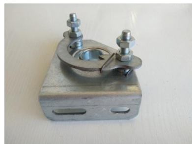
Seguridad del muelle