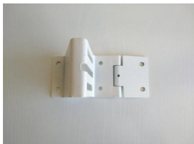
Dintel con bisagra