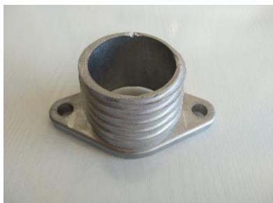
Pieza torsión de muelle 2