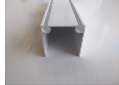
Perfil sin goma