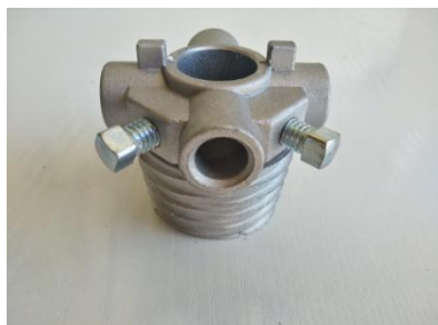
Pieza torsión de muelle 1