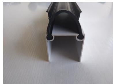
Perfil con goma inferior